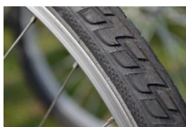
6. Velosipēda riepa