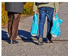
4. Plastmasas maisiņš