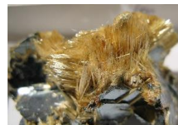
Rutils 5., 8., 9.