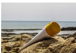
8. Saules aizsargkrēms