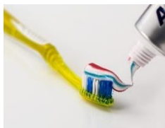
5. Zobu pasta