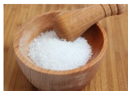
7. Galda sāls