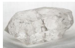
Kvarcs 2., 3., 10.