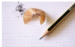
1. Parastais zīmulis