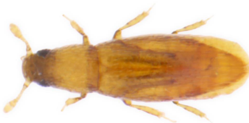
Spalvspārnītis ( Baranowskiella ehnstromi ).

Latvijā šī suga atklāta pirmo reizi, bet „iespējams, dzīvo te jau tūkstošiem gadu un, visticamāk, mazā izmēra dēļ tik ilgi nebija uzzieta,” pieticīgi par sasniegumu saka pētnieks, kurš mūsu zemē atklājis arī vairāk nekā 20 jaunas blakšu sugas un apņēmies arī turpmāk papildināt Dabas muzeja kukaiņu kolekcijas.